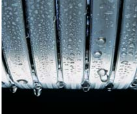
Inox-Radial-Wärmetauscher – langlebig und effizient