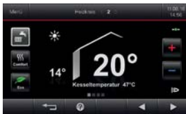
5-Zoll-Farb-Touch-Display der Regelung Vitotronic 200 (Typ HO2B)

* Voraussetzungen und Produktübersicht unter www.viessmann.de/garantie