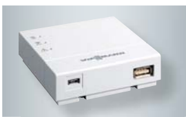
Vitoconnect 100 mit Anschlüssen für das Steckernetzteil (links) und zur Datenverbindung