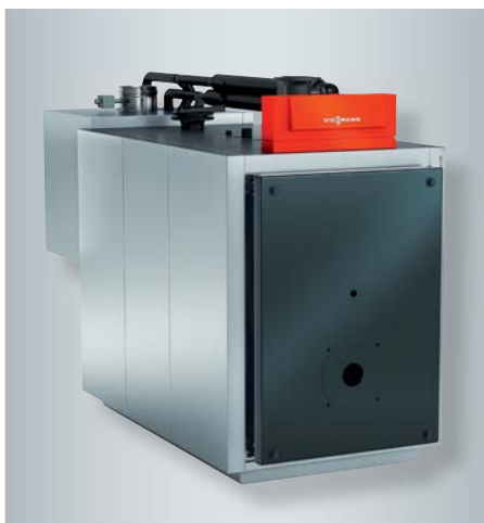
Vitoradial 300-T, 425 und 545 kW