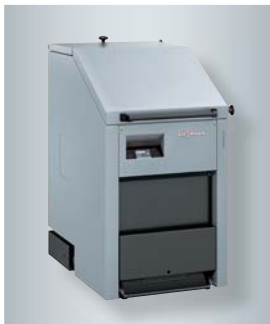
Halbmeter-Scheitholzkessel Vitoligno 250-S, 40 bis 75 kW

Die Fernbedienung Vitotrol 350 mit Touchdisplay wurde vom Design Zentrum Nordrhein-Westfalen mit dem red dot design award 2014 ausgezeichnet.